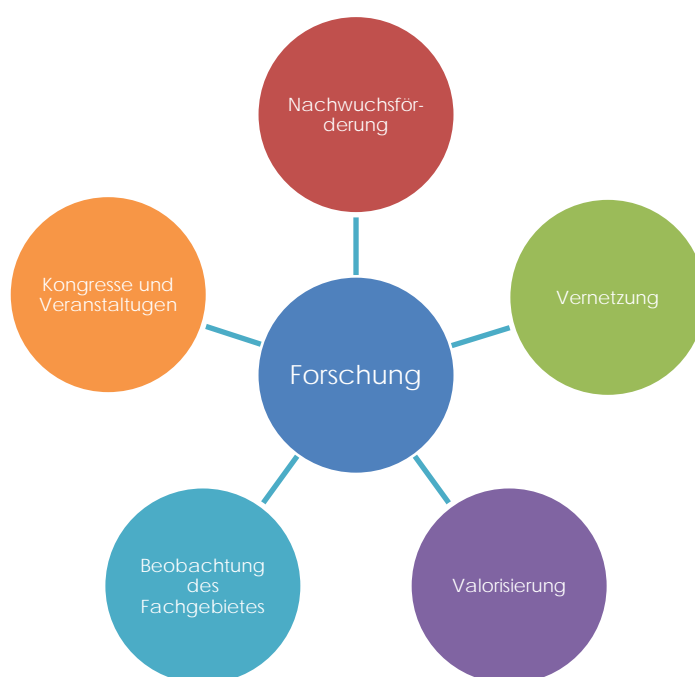
Abbildung 2: Die Aufgaben der Leading Houses als Kompetenzzentren

Auftrag der Leading Houses ist es, in einem definierten, für die Berufsbildung relevanten Schwerpunktbereich Forschung zu betreiben und dabei mit anderen universitären Lehrstühlen oder Hochschulen zusammenzuarbeiten. Sie sind eigentliche Kompetenzzentren und schaffen als solche eine langfristige und dynamische Berufsbildungsforschung auf internationalem wissenschaftlichem Niveau. Ihre Aufgabe geht also über die Durchführung von Forschungsprojekten hinaus. Jedes Leading House erarbeitet seinen Themenbereich umfassend und ist damit auf nationaler und internationaler Ebene präsent. Die folgende Grafik zeigt die Aufgaben der Leading Houses.