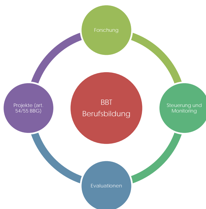
Abbildung 4: Steuerungsinstrumente

Berufsbildungsforschung ist Grundlagenforschung, die qualitativ hochstehende und international anerkannte Forschungsergebnisse erzielt. Langfristig soll sie eine solide Grundlage für die Entscheidungsfindung in der Bildungspolitik und -verwaltung liefern und eine effiziente und wirksame Steuerung der Berufsbildung ermöglichen. Die Forschungsergebnisse werden für die Weiterentwicklung der Berufsbildung systematisch übernommen und verbreitet. Sie geben den Akteuren der Berufsbildung, insbesondere den Organisationen der Arbeitswelt und den Berufsbildnerinnen und Berufsbildnern, Instrumente in die Hand, mit denen sie ihre Bildungsarbeit und die Berufsbildung im Allgemeinen optimieren können.